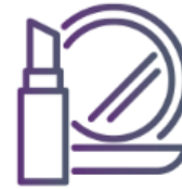
Cosméticos y Aseo