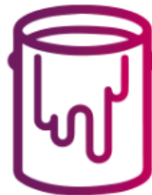
Plásticos y Pinturas